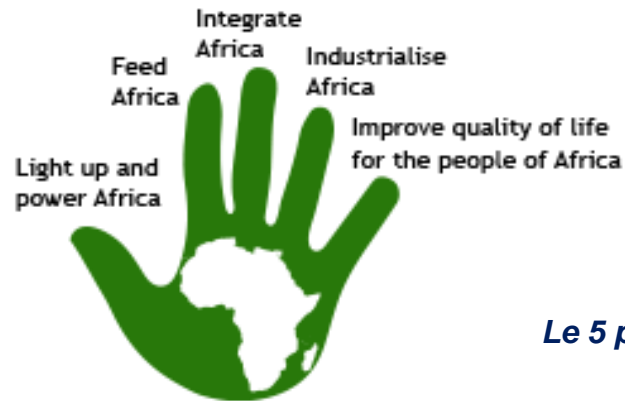
Le 5 priorità della AfDB

.... tutti i settori sono importanti per gli investimenti delle PMI in Africa